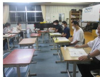
【3密回避の常任委員会】

例年、講師を招いて講習会を行う。毎回、子育てについて学び、新しく気づくことができる。講習会後には、家庭内の問題や悩みの解消を狙いとして食事会を行って、交流を図り情報を交換している。