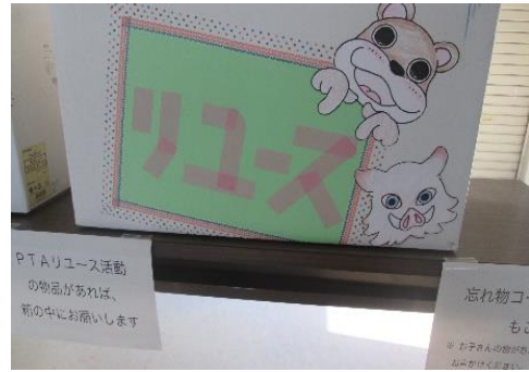
【厚生部手作りのリユース箱】

を行っている。物を大切に作る気持ちと同時に、皆のために貢献する気持ちが育まれる。学校で使用するものを引き継いで使用することで連帯感のようなものも生まれる。今年度は夏期休業中の個人懇談期間に回収できたので、入学説明会、学校公開日等に譲渡予定である。