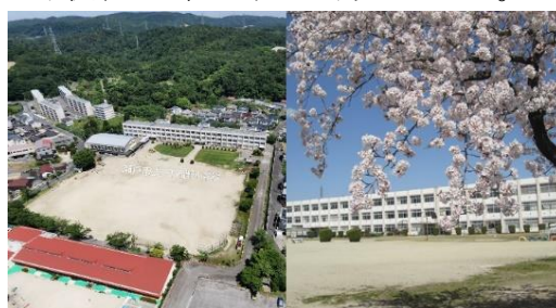
【下品野小学校全景】

現在は、地元生まれ育った世帯が住む地区と他地区からの転居が進む新しい分譲地、外国人世帯が多く住む中層住宅等が混在する。国道 248 号線沿いから蛇が洞浄水場や岩屋堂などの山あいまで学区が広く、通学に 1 時間近くかかる児童も多くいる。