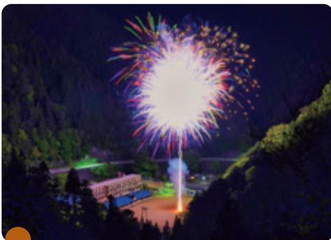
東三河全域で「花火ワクチン大作戦」が行われました。その光に浮かび上がる小学校と中学校、保育園です。消防の見回りなど、安全確保に努めました。