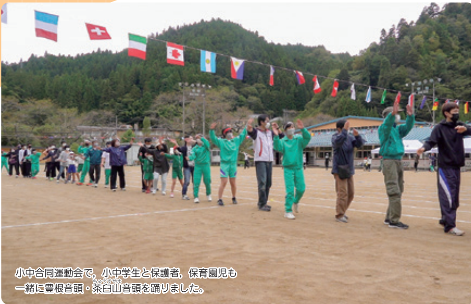
小中合同運動会で、小中学生と保護者、保育園児も一緒に豊根音頭・茶臼山音頭を踊りました。