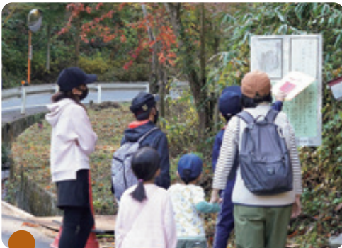
「ここは何?」「ここは弘法山。この上に黒川城があるよ。」自然を楽しむ会では、親子やその友達とで自然の中を歩きました。