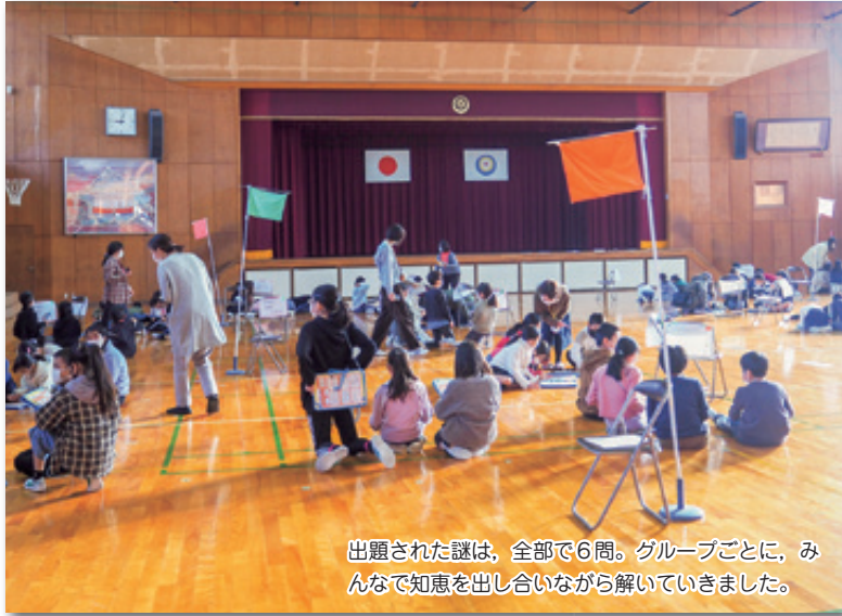
出題された謎は、全部で6問。グループごとに、みんなで知恵を出し合いながら解いていきました。