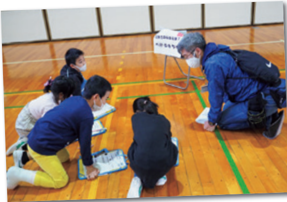
謎が解けるたびに、体育館は子どもたちの笑顔でいっぱいになりました。