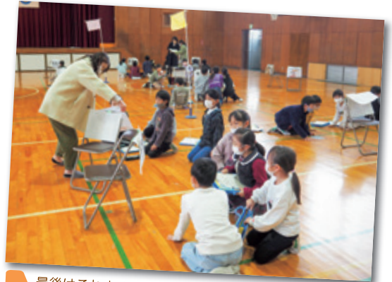
最後はこれまでに解いた謎の答えをヒントに、大謎に挑みました。どれもひらめきが肝心なものばかりでした。

日高小学校PTAでは、昨年度よりバザーを廃止し、「日高っ子フェス」という新たなイベントを立ち上げることにしました。昨年度は「謎解き」を企画しました。コロナ禍でイベント自体の中止も検討されましたが、「校舎周遊ではなく体育館を広く使う」「学年別で入れ替える」「3密を回避しながらローテーションで行う」など、「この状況でも安全に楽しく行うには？」と考えることで無事に実施することができ、日高っ子の楽しそうな笑顔を見ることができました。 今年度は「みんなついでる！日高っ子」を活動テーマに、安心して楽しく学校生活を送ることができるように、また社会的な孤立を防ぐことができるように活動を進めています。「一人じゃないよ」「みんながついてるよ」「みんなラッキー！」そんなことが実感できるような活動を、先生がたや保護者の皆さん、日頃からボランティア活動を行う地域の皆さん、おやじの会、ブックママとともに創っていきたいと思います。