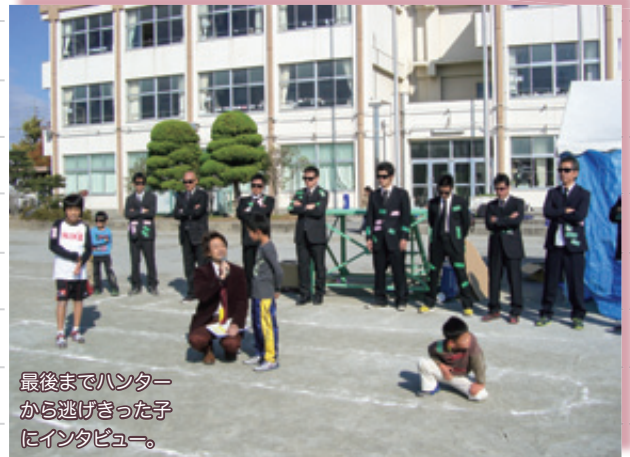
最後までハンターから逃げきった子にインタビュー。

新しい試みの目玉は、テレビでおなじみのゲーム「逃走中」だ。怖そうなサングラスに黒スーツのハンターが登場すると、会場は大盛り上がり。子どもたちは楽しくてしかたがないといった様子で、ハンターから逃げ回っていた。