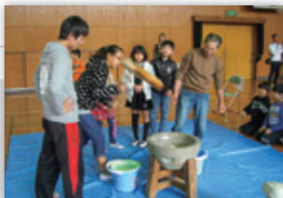
最後は餅つき体験で締めくくり。力いっぱい餅をつき、いただきます。

当日はおやじの会のお父さんや先生たち、それに地域のスポーツ振興会の人々がスタッフとして協力してくれた。みんなで力を合わせたおかげで、活動は大成功！