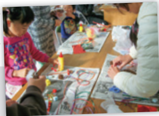
親子で協力して、クリスマスリースも作成。