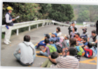
里山整備や京ヶ峯にまつわる話を学区の役員から聞く。

今年度は、 きょうがみね 京ヶ峯山登りコース。当日は、子どもたちと保護者など、600名近い参加者が、標高170mの山頂までの、6kmほどの道のりを歩いた。