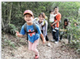
山頂まであと少し。子どもたちは最後まで元気。