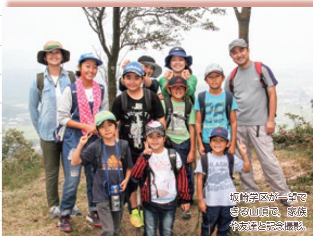
坂崎学区が一望できる山頂で、家族や友達と記念撮影。

このウォークラリーには、3つのコースがあり、3年のローテーションを組んで開催しているようだ。