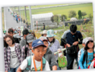
学校から京ヶ峯山頂を目指して、いざ出発！